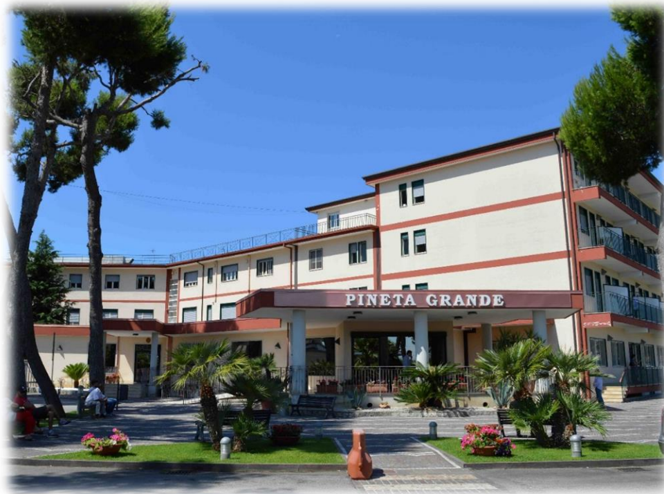
L'ingresso alla struttura

familiari e visitatori. È possibile fare un break e gustare uno snack o un caffè al bar o un pasto gustoso al ristorante presente in struttura e acquistare il necessario per il parto e la nascita presso lo Store al piano terra. Per i momenti di preghiera e la messa domenicale è presente un'accogliente cappella benedetta. Nella struttura è presente uno sportello ATM ed è attivo un servizio di sorveglianza H24.