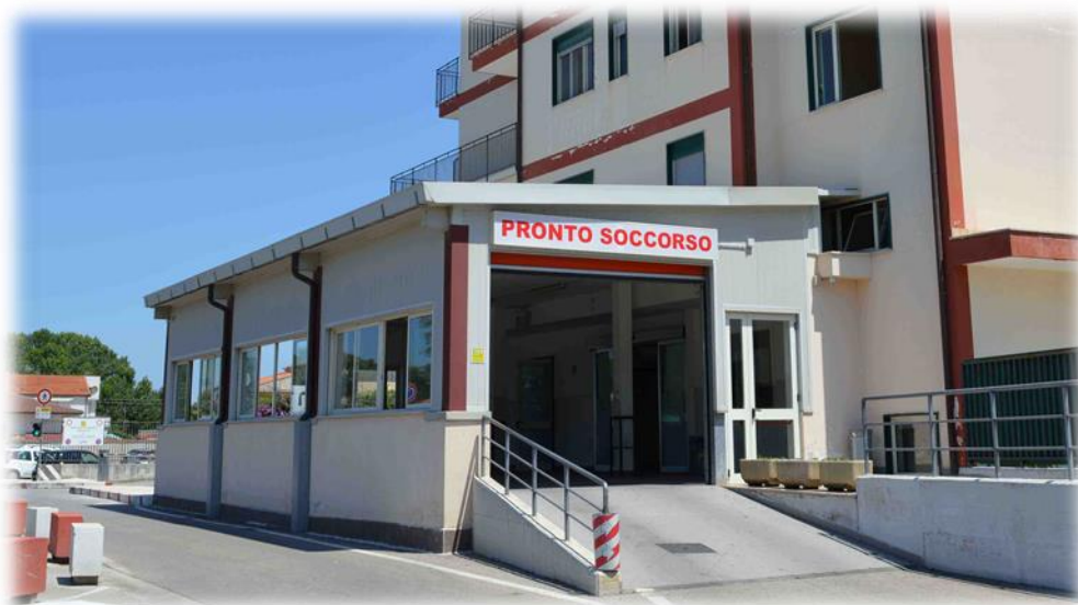
L'ingresso al Pronto Soccorso